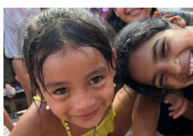
Tinkuy de verano