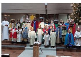
Stensinger an Drei-König

Die drei Monate Sommerferien, die die Schüler*innen in Santiago del Estero haben, können sehr lang sein für Kinder,