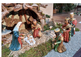
Krippe St. Columban