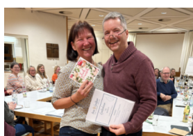
Dank für 25 Jahre Chorarbeit