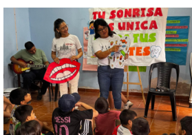
Tinkuy de verano