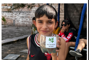
Tinkuy de verano