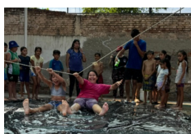
Tinkuy de verano