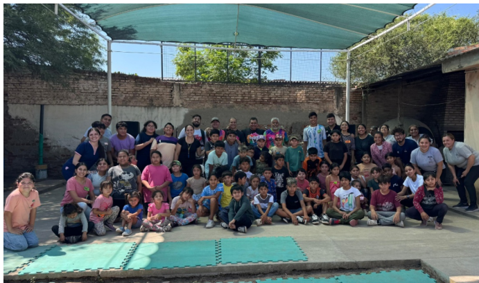
Die Teilnehmer des diesjährigen Tinkuy de verano

die in schwierigen familiären oder ökonomischen Strukturen leben. Mit Tinkuy de Verano, einer Sommerferienbetreuung, möchten wir einen sicheren Ort der Unterstützung und Geborgenheit bieten. Unser Ziel ist es, ihnen eine unvergessliche Erfahrung voller Gemeinschaft, Spiele, Spaß und Momenten des Lernens und Wachsens zu schenken.