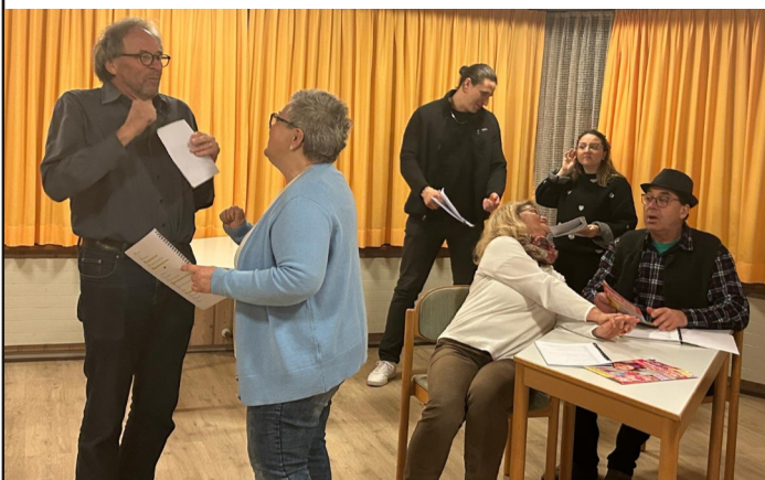
Probe für "Institut Amore"