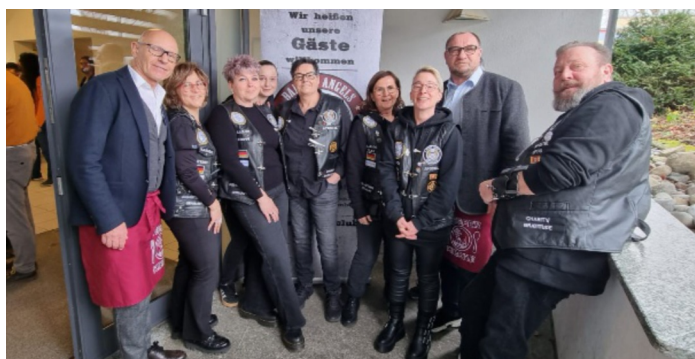
Die Barber Angels

Unter die Helfer mischten sich fast jeden Tag eine Klasse von der Osswald- und Schreieneschule. Dem Vorbereitungsteam war es wichtig die jungen Menschen einzu-