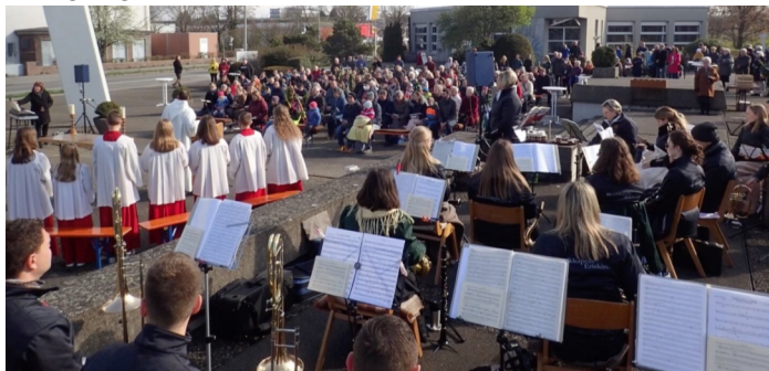
Palmsonntag 2022 auf dem Kirchplatz

Am Palmsonntag hat die Gemeinde bei uns zwei verschiedene Möglichkeiten. Der Palmsonntag ist generell von zwei Stimmungen geprägt: der freudige Einzug nach Jerusalem und dann das jähe Umschlagen der Gefühle als Jesus in seine Leidenszeit hineingeht. Wir wollen den Vorabend des Palmsonntags dergestalt begehen, dass wir in der Eucharistiefeier nach dem Evangelium vom Einzug in Jerusalem gleich die Passionsgeschichte hören wollen in der Version des Lukas. Sie ist einzigartig.