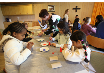
Osterfest Helferkreis Asyl

Passend dazu wurde im Evangelium von der Berufung der ersten Jünger erzählt: Jesus rief Simon, Johannes und Jakobus nach einem reichen Fischfang zu sich. Ein Neuanfang – wie