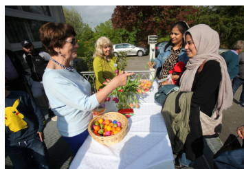
Osterfest Helferkreis Asyl