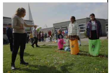
Osterfest Helferkreis Asyl