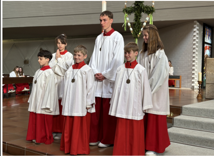
Die drei neuen Ministranten (vordere Reihe)

dies nur wenige Stunden täglich sein, die über einen Zeitraum von voraussichtlich 4 Wochen langsam auf das normale Niveau gesteigert werden. Ich freue mich, dass ich nun wieder hier an diesem Punkt sein kann. Mein Dank gilt allen, die mich in den letzten Monaten in so vielfältiger Weise unterstützt haben, sei es in der Organisation oder durch praktische Tätigkeit, mit ihren Gedanken und Gebeten, für ihr Da-Sein. (Angelika Fischer)