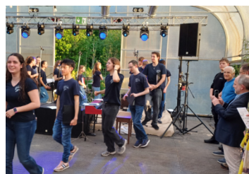
Der OB filmt die Stars des Abends