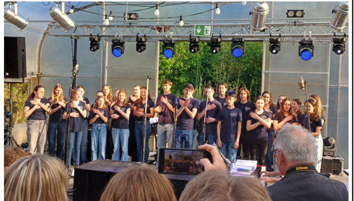
Der Jugendchor im Gewächshaus

Festival wurde von Studierenden der Zeppelin Universität organisiert. In diesem Jahr fanden die beiden Anlässe erstmals gemeinsam statt.