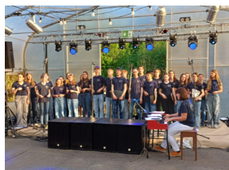
Jugendchor im Gewächshaus