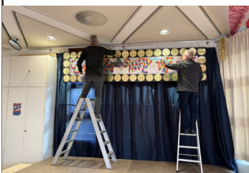
Fasnet dekorieren Arche