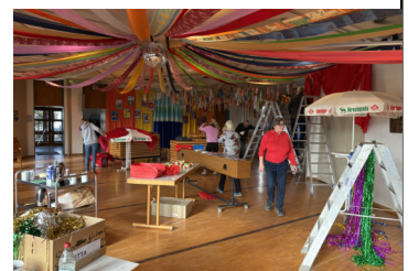
Fasnet dekorieren Arche