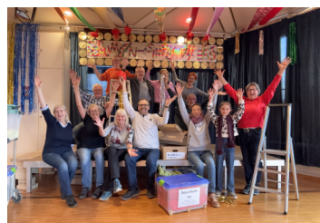
Fasnet dekorieren Arche