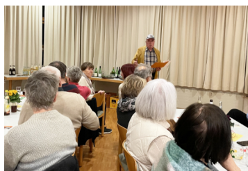
Kolping Weihnachtsmarkt Dankeessen