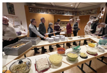
Kolping Weihnachtsmarkt Dankeessen