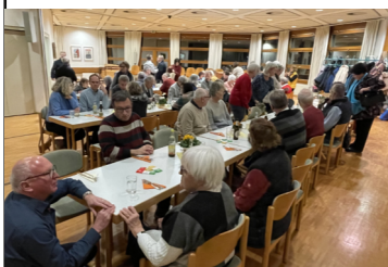
Kolping Weihnachtsmarkt Dankeessen