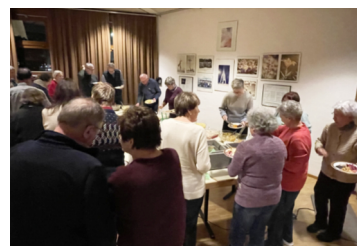
Kolping Weihnachtsmarkt Dankeessen