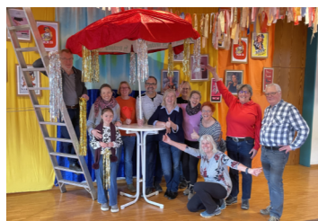
Fasnet dekorieren Arche