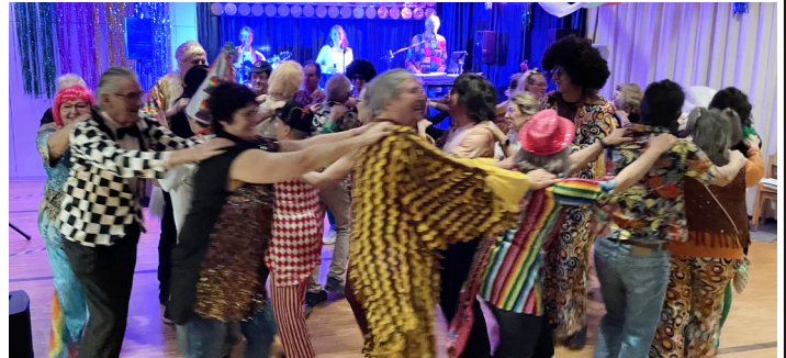
Tolle Stimmung bei der Columbanfasnet "Golden Sixties"