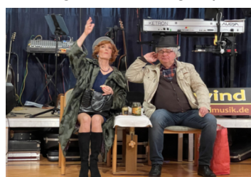
Columbanfasnet "Golden Sixties"