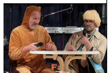
Columbanfasnet "Golden Sixties"

entgehen lassen. Gespielt wird, wie immer für karitative Zwecke.