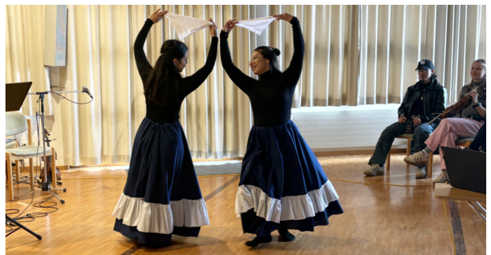
Tanz beim Benefizkonzert für Sommerferienbetreuungsprojekt Argentinien

Eine eindrucksvolle und lohnende Ausstellung für die Fastenzeit, zu sehen im Bonhoefferhaus bis zum 6.4.2026. (Uli Baum)