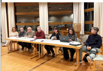
HV FöV Chöre & Kirchenmusik

Heute erfreuen sich die Chöre großer Beliebtheit, und auch die Bereitschaft, den Förderverein durch eine Mitgliedschaft zu unterstützen, ist deutlich gestiegen. Gut besuchte Konzerte und Veranstaltungen, zahlreiche – teils sehr großzügige – Spenden sowie die Mitgliedsbeiträge sichern weiterhin die finanziellen Grundlagen für die Arbeit des Vereins.