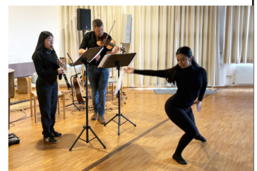
Tanz beim Benefizkonzert