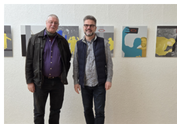
Vernissage zum Kreuzweg