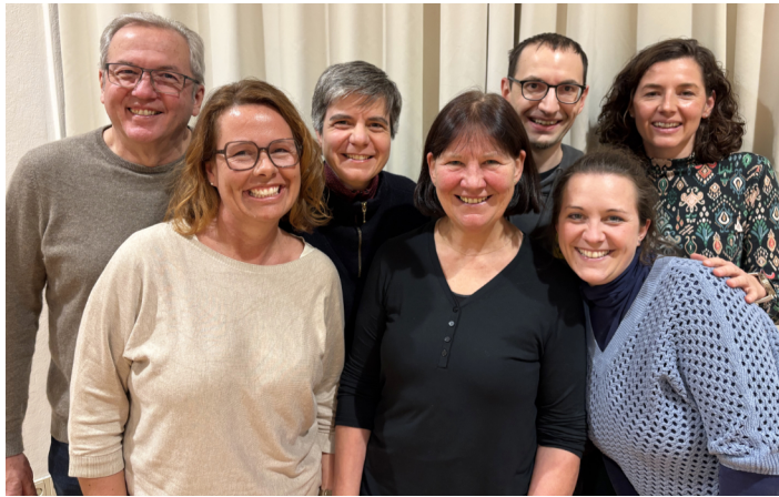
Der neue Vorstand des Fördervereins Chöre & Kirchenmusik