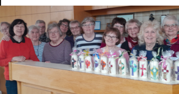
Osterkerzen der Frauenrunde