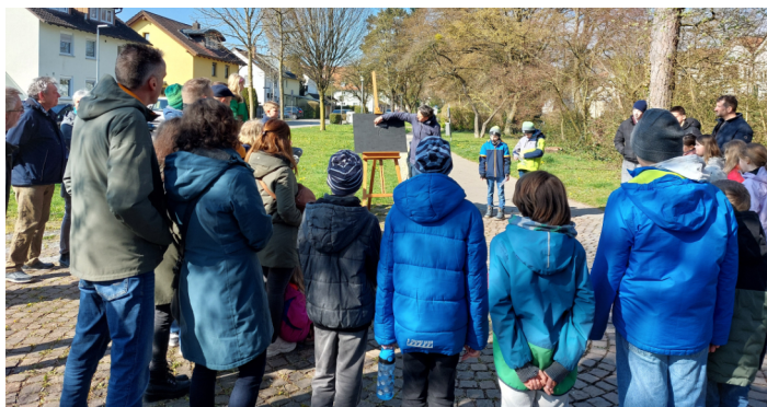
Station am Familienkreuzweg

Eine leere Tafel, ein Stück Kreide und eine Geschichte: Aus ein-fachen Kullermännchen und Symbolen entstehen Bilder. Schritt für Schritt erzählen sie die Leidensgeschichte Jesu in sieben Stationen. Über 30 Kinder, Eltern, Erwachsene sowie Oma und Opa folgten dem Familienkreuzweg durch das Quartier.