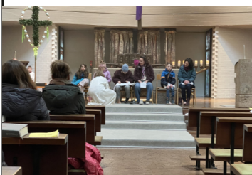
Fußwaschung an Gründonnerstag

Neben operativen Themen, also Vorbereitung der nächsten Anlässe und vielen Informationen (Ausblick/Rückblick) ging es im Rat besonders um die geplante Exkursion nach Zürich. Hier wollen sich die Mitglieder schlau machen bei der Gemeinde St. Elisabeth, die sich schon vor vielen Jahren in der Quartiersarbeit einen Namen gemacht hat. Wir sind gespannt und lernen gerne noch etwas dazu. (Bernd Herbinger)