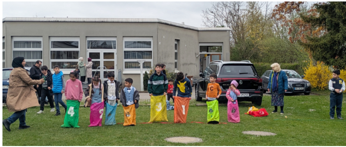
Sackhüpfen beim Osterfest Asyl

Trotz schlechtem Wetter kamen wieder viele Besucher zu unserem jährlichen Osterfest. Bräuche wurden mit einer Präsentation erklärt und die Kinder konnten im Unterdeck spielen und basteln. Anschließend ging es nach draußen zur Ostereiersuche und zu Spielen wie Dosenwerfen, Sackhüpfen oder Eierlauf. (Sarah Kessler)