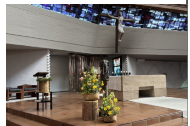
Blumenschmuck zu Ostern