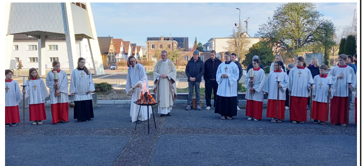
Entzünden des Osterfeuers