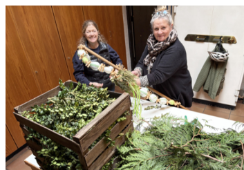
Bindes des Palmenkreuzes