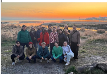
Teilnehmer des Antirassismus-WE

Am 12. April feierten 19 Kinder in St. Columban ihre Erstkommunion. Unter dem Motto: "Ihr seid meine Freunde" gab es in den letzten Monaten immer wieder Gruppentreffen. Nach der Erstbeichte und Palmenbasteln feierten die Kinder auch in der Karwoche gemeinsam Gottesdienste und nun diesen besonderen Tag mit den Familien als ihr großes Fest. (Christina Bucher)