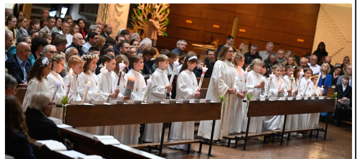
Die Erstkommunionkinder in St. Columban

Am 12. April feierten 19 Kinder in St. Columban ihre Erstkommunion. Unter dem Motto: "Ihr seid meine Freunde" gab es in den letzten Monaten immer wieder Gruppentreffen. Nach der Erstbeichte und Palmenbasteln feierten die Kinder auch in der Karwoche gemeinsam Gottesdienste und nun diesen besonderen Tag mit den Familien als ihr großes Fest. (Christina Bucher)