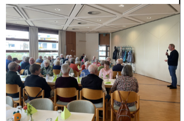
Mittagessen der Senioren