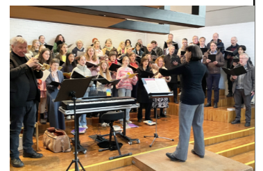
Chor an Ostersonntag